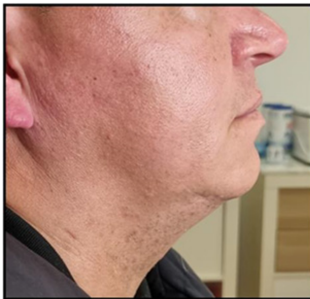
Figura 3: Após a 10ª aplicação